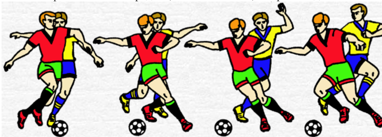
Рис. 2. Техника выполнения финта “ухода” с переносом ноги через мяч.

Финты “ударом” по мячу ногой. Обманные движения “ударом” крайне разнообразны как по способам выполнения подготовительной фазы, так и по разновидностям реализации истинных намерений. Варьируются и условия исполнения финтов: после передачи, остановки мяча, во время ведения.