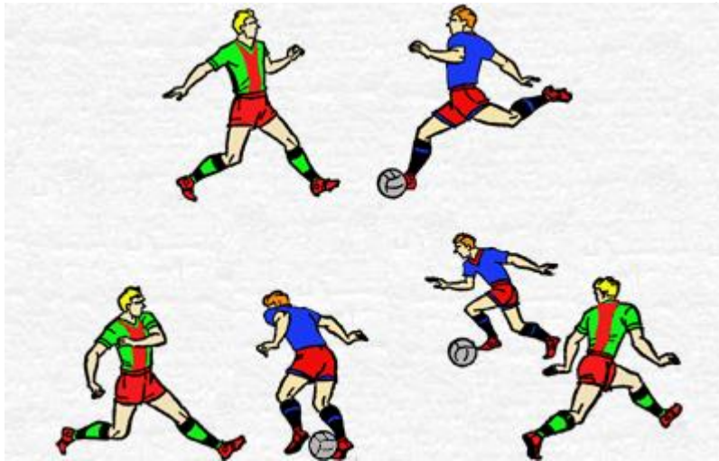
Рис. 3. Техника выполнения финта “ударом” ногой.