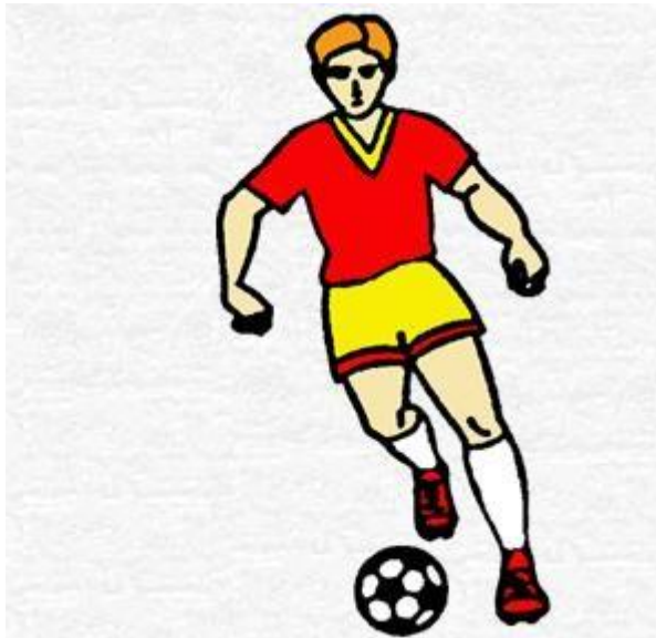
Рис. 1. Техника выполнения финта “ухода” выпадом.

Рассмотрим действия футболиста при обманном движении вправо и уходе влево. Сближаясь с противником на расстояние 1,5-2 м, игрок толчком левой ноги выполняет широкий выпад вправо-вперед. Причем, проекция ОЦТ не доходит до площади опоры. Возникающее при этом неустойчивое равновесие будет способствовать дальнейшему движению. Соперник пытается перекрыть зону прохода и перемещается в сторону выпада. Тогда резким толчком правой ноги игрок, выполняющий финт, делает широкий шаг влево. Внешней частью подъема левой ноги мяч посылается влево-вперед.