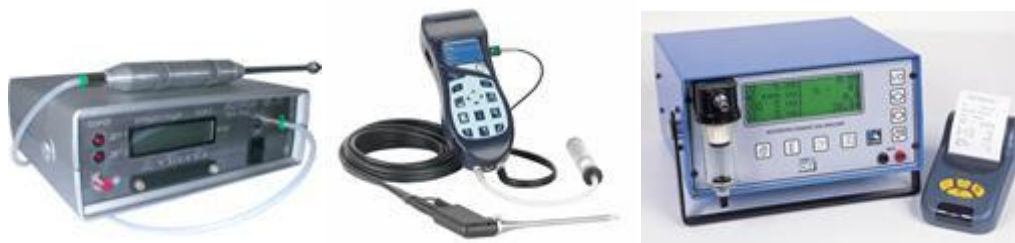
Рис. 74. Газоанализаторы автомобильные

7. Токсичность отработавших газов проверяют на холостом ходу, используя газоанализатор (рис. 74).